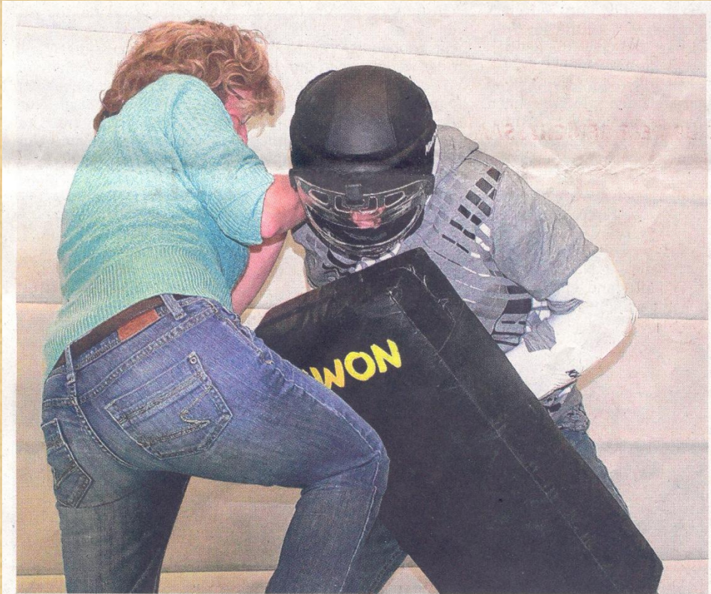
Selbstverteidigungskurs für die TSV-Frauen erfolgreich: „Keine von uns verfällt mehr in Schockstarre.“