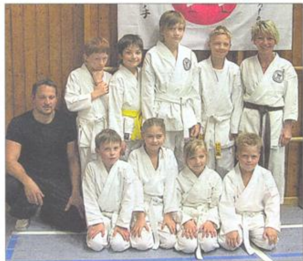
Die Prüflinge mit ihren Trainern