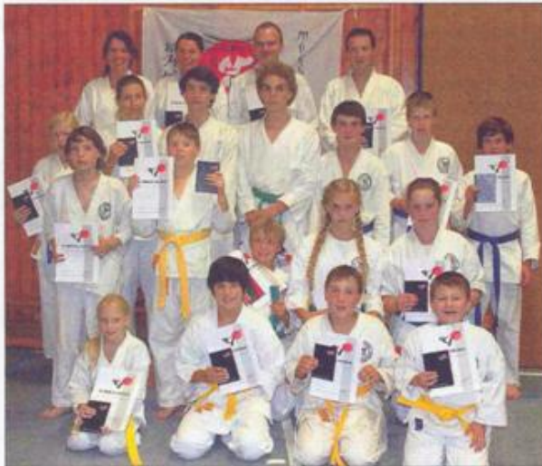
Die erfolgreichen Prüflinge