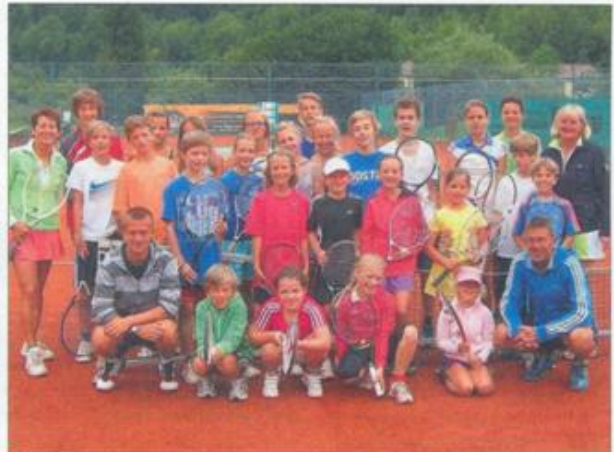
Trainer und Teilnehmer des Großfeld-Tenniscamp 2012 (zusammen mit dem TC Übersee).

Durch viele neuen Spiele und exakte Technikschiulung konnte die Kinder in diesen drei Tagen ihr Niveau nochmals deutlich verbessern. Vielen Dank auch nochmals an die vielen ehrenamtlichen Helfer beim Kleinfeld-Camp.