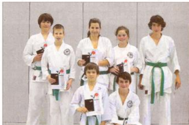
erfolgreiche Prüflinge ...

Zeigen Sie Farbe! Lassen Sie sich von uns beraten: 08641/9781-0