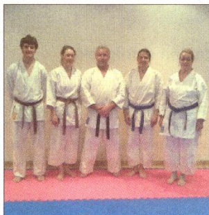
Die Prüflinge mit Prüfer nach bestandener Prüfung