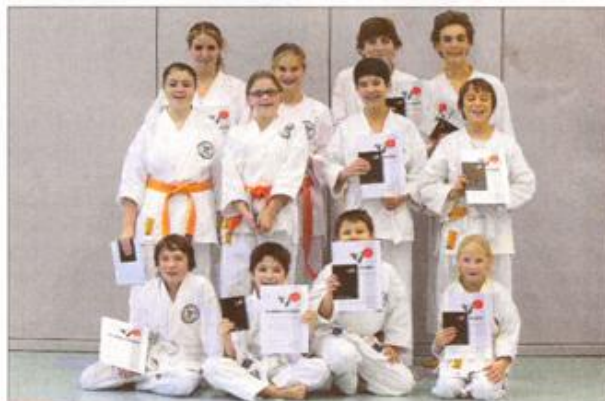
... und noch mehr von ihnen

Der vierte Adventssamstag war bei den Marquartsteiner Karatekas Trainingstag: aus ganz Bayern kamen zu einem Lehrgang die Teilnehmer, darunter auch zahlreiche Kinder und Jugendliche aus Marquartstein.